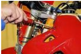
DÉPOSE DU FLAN DE CARÉNAGE DROIT.

ACCÈS À LA BOBINE HAUTE TENSION POUR LE MODELE XP6 PEUGEOT.