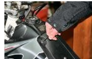
RETIRER LES VIS DE FIXATION SUPÉRIEURES DES FLANS DROIT ET GAUCHE SUR LE RÉSERVOIR.