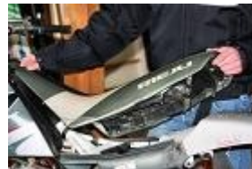
RETIRER LA SELLE.