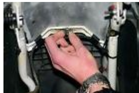
RETIRER LE PAPILLON SOUS LA SELLE.