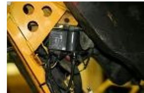
RETIRER LA BOBINE HAUTE TENSION EN DÉBRANCHANT TOUS LES CÂBLES.