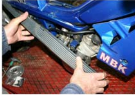
Dépose du marche pied latéral droit.

PRÉPARER UNE BOITE AVANT DE COMMENCER POUR RANGER TOUTES VIS RETIRÉES AFIN DE LES RETROUVER AU REMONTAGE.