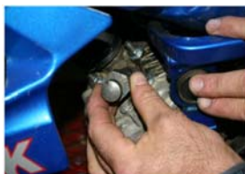
Présenter la pige de calage à la place de la bougie et serrer la vis de la pige à fond.