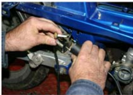
Déposer la bobine haute tension d'origine.