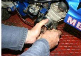
Dépose du cache allumage.