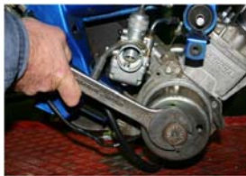
Tourner le rotor dans le sens inverse jusqu'à son blocage et desserrer l'écrou avec une clé de 32.