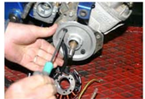
Fixer la platine avec les 2 vis 6x20 têtes fraisées en contrôlant qu'elle plaque bien contre le carter moteur et qu'aucune vis de carter ne gêne.