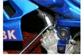
Retirer la bougie avec une clé de 21.