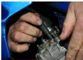
Placer un bloque piston à la place de la bougie.