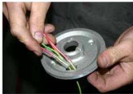
Passer les câbles de sortie du stator par le trou de la platine.