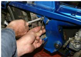
Positionner les 2 vis BTR 6x35 avec les écrous, rondelles et contre écrou fournie pour faire un support à la bobine haute tension du Millénium MVT