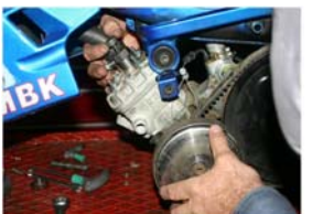
Faites tourner le moteur dans le sens de rotation en desserrant la vis de réglage de la pige de calage jusqu'à ce que le piston vienne au point mort haut. Une fois trouver le point mort haut ne toucher plus à la pige de calage et continuer à faire tourner le moteur d'un demi tour.