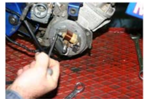
Déposer les vis de fixation du stator.