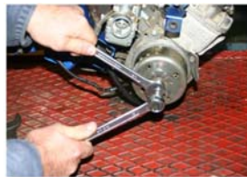
Présenter l'extracteur MBK et débloquer le rotor avec les clés correspondantes.