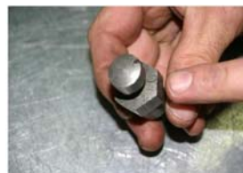
Munissez vous d'une pige de calage.