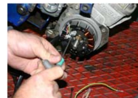
Fixer le stator sur la platine avec les 3 vis 4x30 fournies.